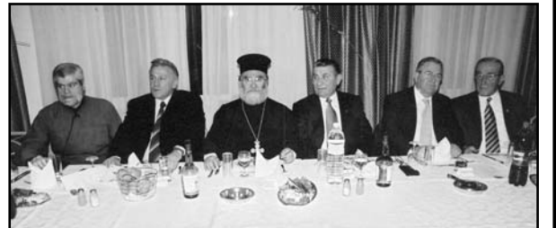
Το τραπέζι των Προσκεκλημένων

Στο τέλος και αφού οι προσκεκλημένοι μας είχαν φύγει και οι σερβιτόροι του κέτερινγκ μάζεσαν τα σκεύη, το συμβούλιο στην είσοδο της αίθουσας, κάνοντας έναν γρήγορο πρώτο απολογισμό της εκδηλώσεως διαπίστωσε, ότι η οργανωτική προσπάθεια απέδωσε, ότι γέμισε η αίθουσα, το κέφι διατηρήθηκε αμείωτο, το πρόγραμμα τηρήθηκε, το φαγητό ήταν καλό και τα έσοδα περισσότερο από ικανοποιητικά. Ο στόχος της συσπειρώσεως και προβολής του Συνδέσμου μας προωθήθηκε αποτελεσματικά. Και του χρόνου λοιπόν!