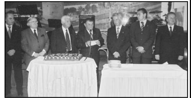
Ο Πρόεδρος και τα Μέλη του Δ.Σ.

Το Σάββατο 12 Φεβρουαρίου έγινε, στην ευγενώς προσφερθείσα αίθουσα της λέσχης αξιωματικών, η καθιερωμένη κοπή της πίτας για το 2005 και η χοροεσπερίδα του συνδέσμου μας με εξαιρετική επιτυχία.